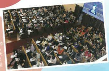
• 5月1日「同性戀移17」研討會當天共308人出席，坐滿整個禮堂