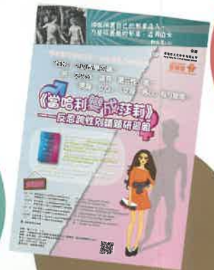
• 6月至10月共舉辦了四場《當哈利變成莎莉》研習組，以上是宣傳海報